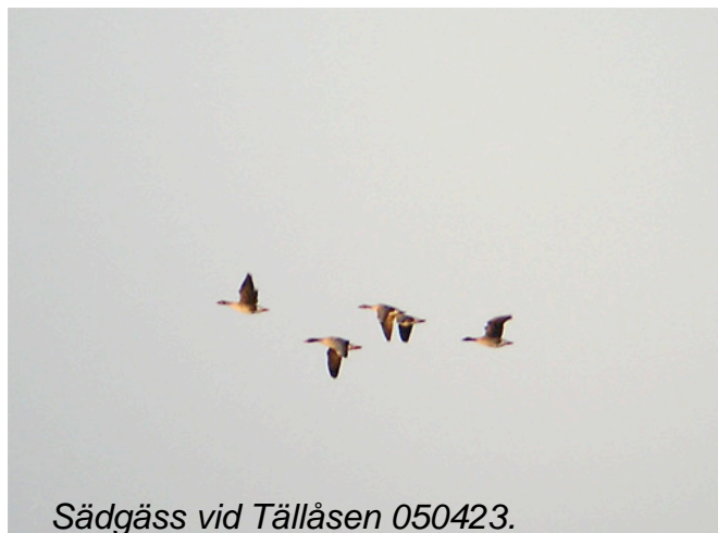
Sädgäss vid Tällåsen 050423.

Kör gärna vägen över Drängsmarkskläppen på väg till eller från Ostträsket. På odlingsmarkerna runt byn rastar ofta stora mängder gäss, tranor och sångsvanar.