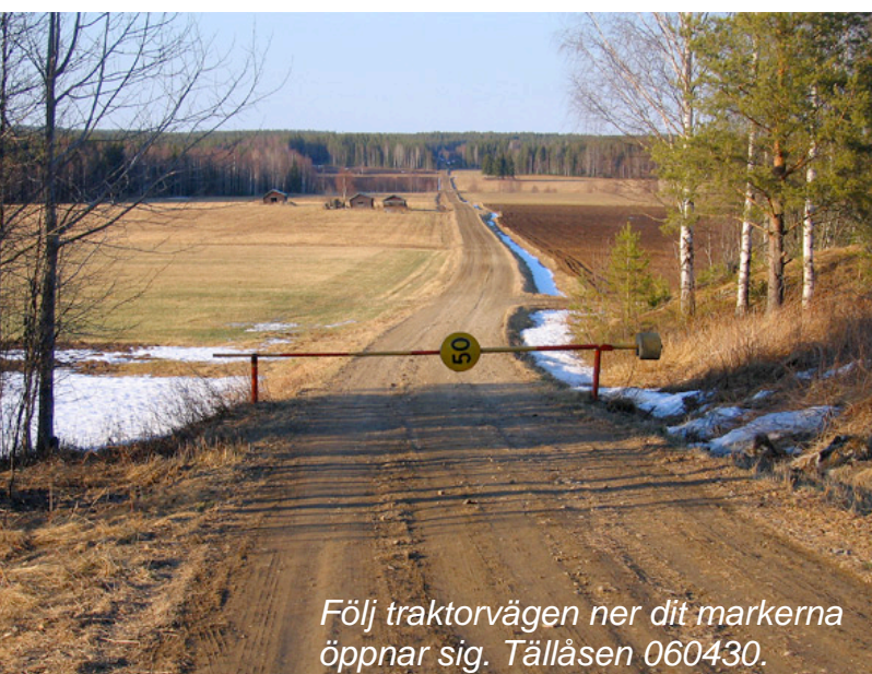
Följ traktorvägen ner dit markerna öppnar sig. Tällåsen 060430.

Sjön når man om man fortsätter huvudvägen genom nittiograderssvängen och Tällåsen tills den slutar på en gårdsplan där det finns en p-skytt. Parkera och följ stigen 200-300m ner till sjön och fågeltornet. Precis vid fågeltornet rinner bäcken ut i sjön vilket gör att den delen öppnar sig tidigt och där samlas större mängder sjöfågel.