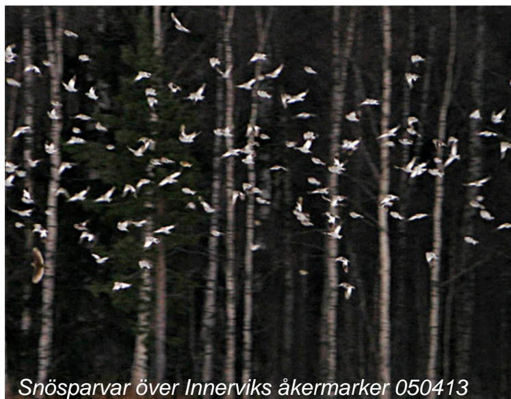
Snösparvar över Innerviks åkermarker 050413

bläsgås, spetsbergsgås, vitkindad gås, snatterand, bergand, årta, fjällpipare, havsörn, jaktfalk, pilgrimsfalk, lappuggla, gräshoppsångare, rörsångare, kornknarr, näktergal, trädlärka.