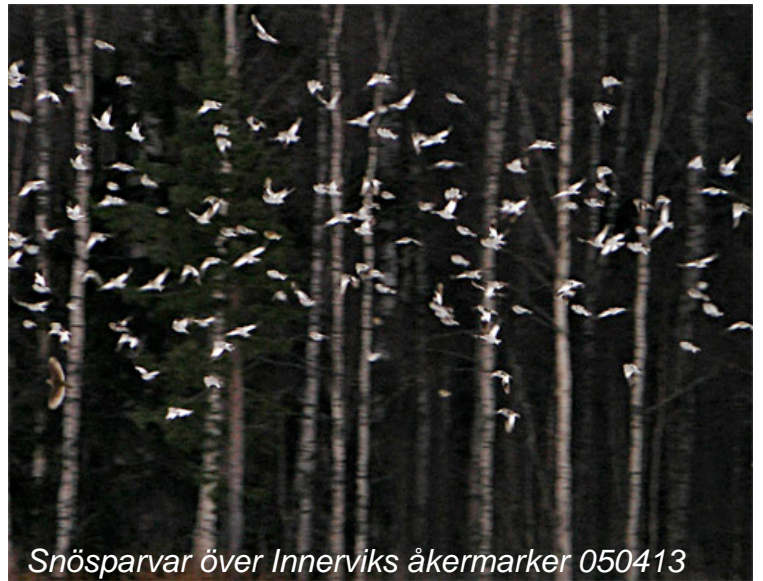
Snösparvar över Innerviks åkermarker 050413

bläsgås, spetsbergsgås, vitkindad gås, snatterand, bergand, årta, fjällpipare, havsörn, jaktfalk, pilgrimsfalk, lappuggla, gräshoppsångare, rörsångare, kornknarr, näktergal, trädlärka.