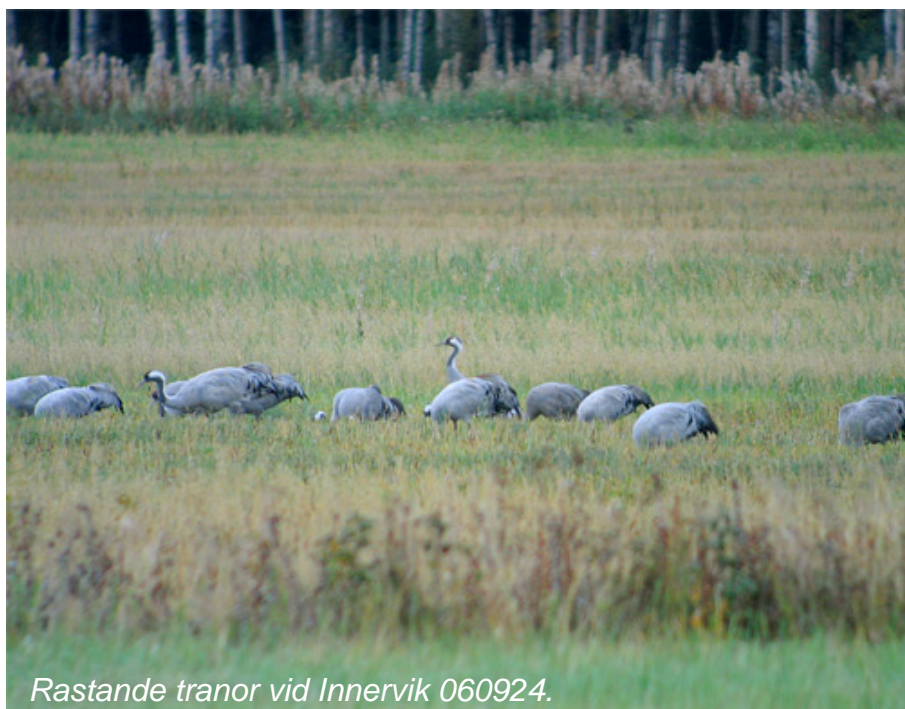
Rastande tranor vid Innervik 060924.

Runt mitten av september är en bra tid för ett besök i området på höstsidan. Trots att folk ofta förknippar fågelskådning med våren så finns det minst lika mycket fågel att njuta av under hösten. Flockar på tusentals bo- och bergfinkar myllrar över fälten, rovfåglar av samma arter och numerär som på våren passerar nu åt söder och tranor och gäss rastar i hyggliga antal. I snår och buskage smyger nu blåhakar och videsparvar, arter man sällan ser här på våren. En kylig dag med frisk nordlig vind i slutet av månaden efter en period med varmare väder är ett