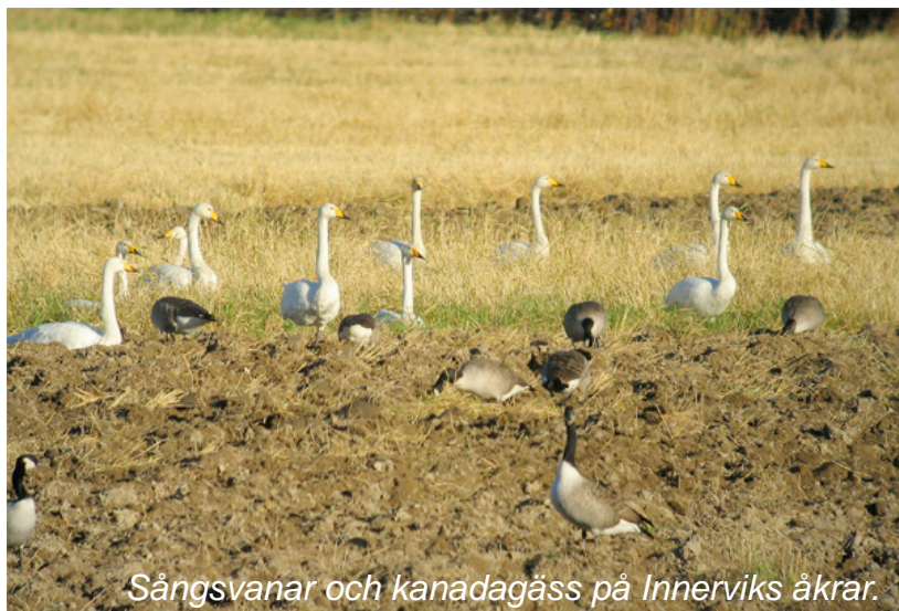
Sångsvanar och kanadagäss på Innerviks åkrar.