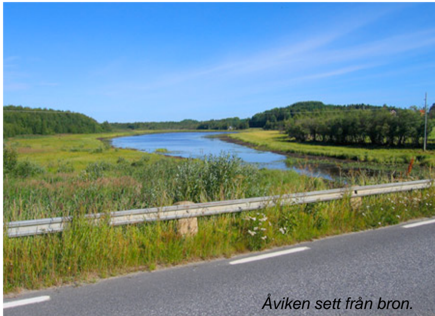
Åviken sett från bron.