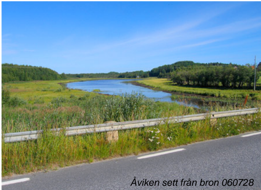
Åviken sett från bron 060728