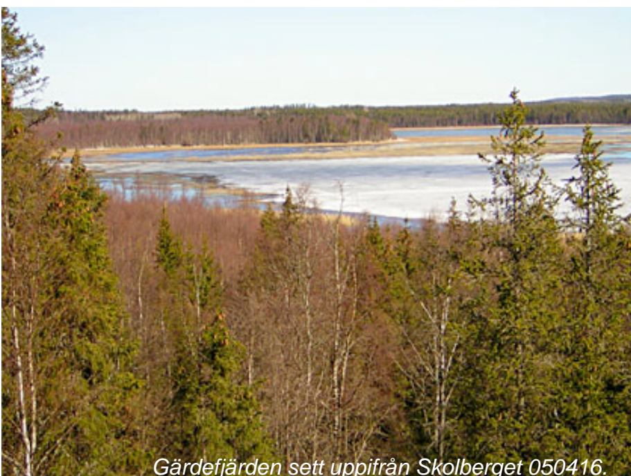
Gärdefjärden sett uppifrån Skolberget 050416.

Runt mitten av april öppnar sig isen i Gärdefjärden och de första fåglarna lägger sig på plats. Vanligast är sångsvan, gräsand, kricka, bläsand, vigg, knipa, sädgås, grågås, kanadagås. Stjertänder och salskrakar ses även de ganska allmänt. Fiskgjuse fiskar dagligen i sjön och ibland även havsörn. Dvärgmåsar ses från början av maj. Brun kärnhök häckar sannolikt vissa år. Mindre hackspett hörs ofta ropa i de fuktiga lövskogarna runt fjärden. Enkelbeckasin är talrik. Runt midsommar och en bit in i juli sjunger nattetid sävsångare flitigt i vassarna i den centrala delen.