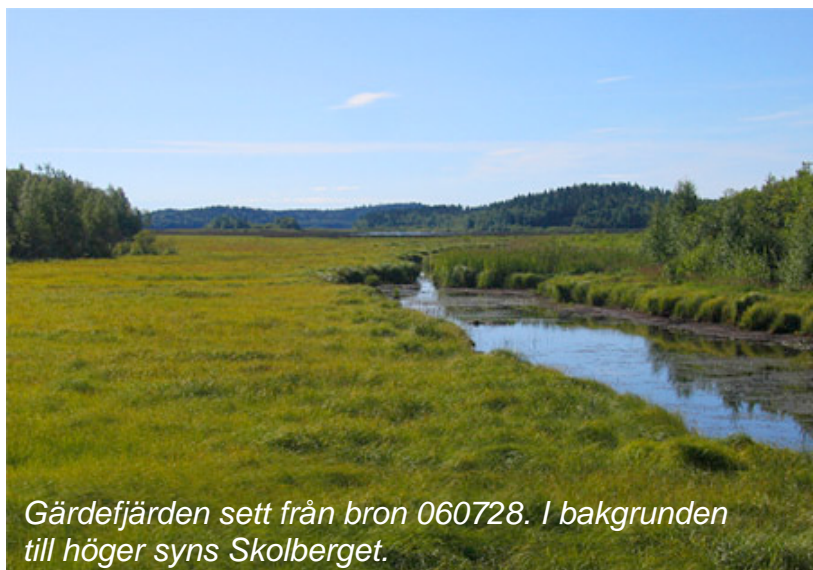
Gärdefjärden sett från bron 060728. I bakgrunden till höger syns Skolberget.

"040420. Efter en morgon på Bjuröklubb stannade vi till vid Gärdefjärden vid 11-tiden. Klart och ca 10 grader. Vi stannade först på bron vid Åviken, och körde sedan upp på Skolberget inne i Lövånger. Totalt sågs bl a: sädgås 63, grågås 211, bläsgås 1, trana 89, storspov 15, stjärtand 10, brun kärrhök 1, havsörn 1, stare 30."