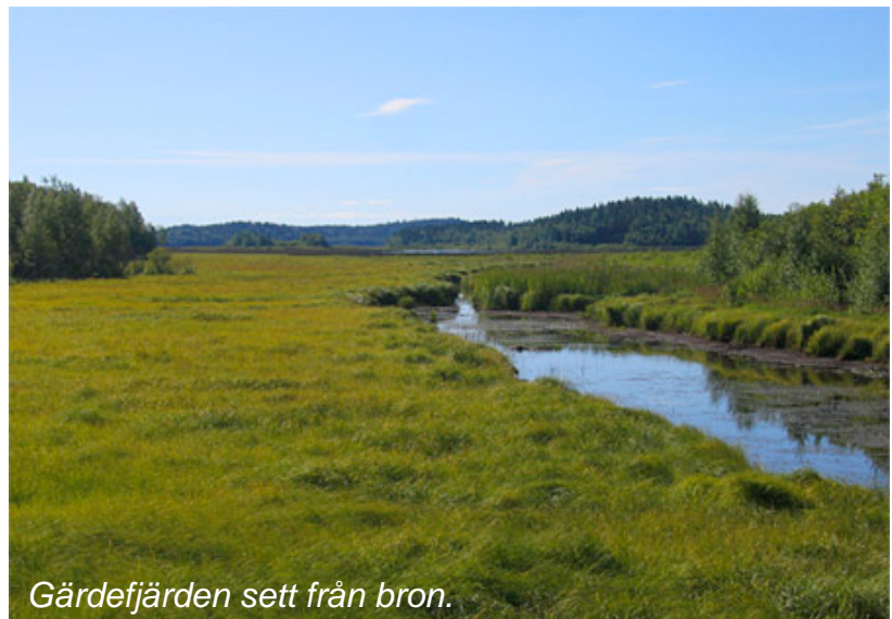
Gärdefjärden sett från bron.

"040420. Efter en morgon på Bjuröklubb stannade vi till vid Gärdefjärden vid 11-tiden. Klart och ca 10 grader. Vi stannade först på bron vid Åviken, och körde sedan upp på Skolberget inne i Lövånger. Totalt sågs bl a: sädgås 63, grågås 211, bläsgås 1, trana 89, storspov 15, stjärtand 10, brun kärrhök 1, havsörn 1, stare 30."