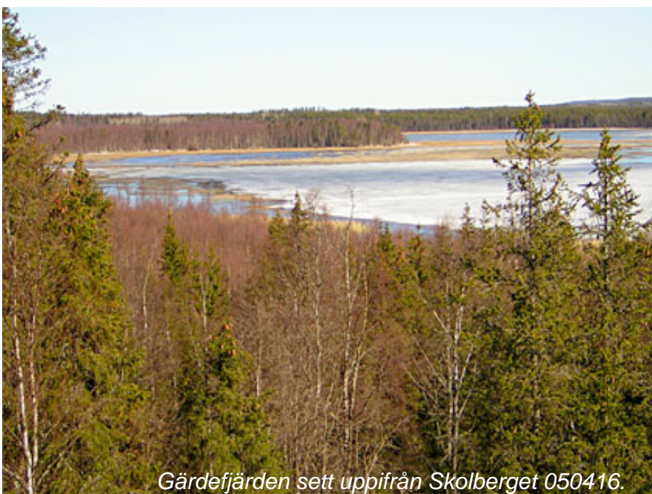
Gärdefjärden sett uppifrån Skolberget 050416.

Runt mitten av april öppnar sig isen i Gärdefjärden och de första fåglarna lägger sig på plats. Vanligast är sångsvan, gräsand, kricka, bläsand, vigg, knipa, sädgås, grågås, kanadagås. Stjertänder och salskrakar ses även de ganska allmänt. Fiskgjuse fiskar dagligen i sjön och ibland även havsörn. Dvärgmåsar ses från början av maj. Brun kärnhök häckar sannolikt vissa år. Mindre hackspett hörs ofta ropa i de fuktiga lövskogarna runt fjärden. Enkelbeckasin är talrik. Runt midsommar och en bit in i juli sjunger nattetid sävsångare flitigt i vassarna i den centrala delen.