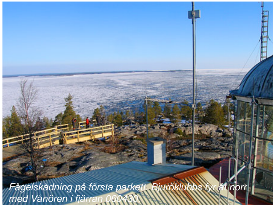
Fågelskådning på första parkett. Bjuröklubbs fyr åt norr med Vänören i fjärran 060430

Fåglarna passerar snabbt och artbestämningen görs ofta enbart på deras lockläte. Att hinna med att plocka ut guldkornen i denna framvällande fågelmassa kräver sin man. En och annan ringtrast, trädlärka och bändelkorsnäbb drunknar lätt i mängden, om man inte har tur och hinner uppfatta deras lockläte. Att stå mitt i denna framrusande våg av vårfåglar ger en euforisk känsla och den som har lärt sig uppskatta det ser det som en av vårens största höjdpunkter!