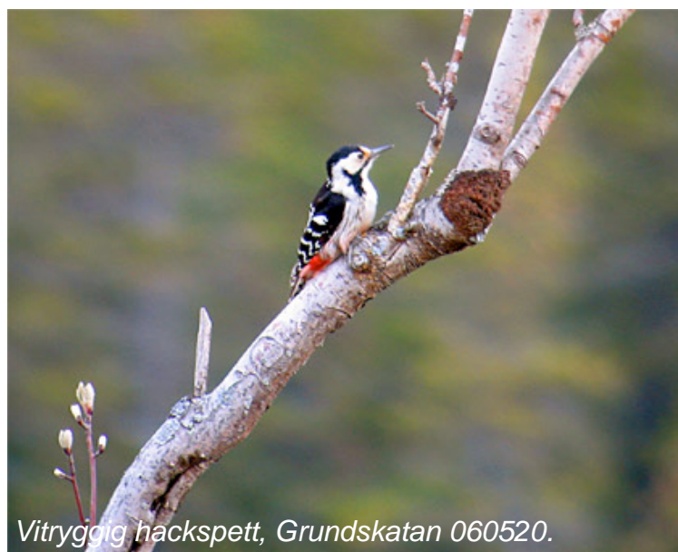
Vitryggig hackspett, Grundskatan 060520.

"Grundskatan, Bjuröklubb 20 maj 2006. Spaning över havet efter sträckande sjöfågel mellan kl 02:45 och 09:30. Sex plusgrader, men stigande, mulet, vind från syd 1m/s, god sikt. Fint nordgående sjöfågelsträck. Lommar 328 (huvudsakligen storlommar), alfågel 106, sjöorre 185, svärta 129, ejder 12, småskrake 44, kustlabb 4 och sist men inte minst en adult bredstjärtad labb kl 09:16, som i makligt men bestämt tempo arbetade sig norrut på låg höjd ca två kilometer ut. Dessutom helt oväntat en rastande hane vitryggig hackspett som rörde sig oroligt mellan småbuskarna på piren och skogen innanför."