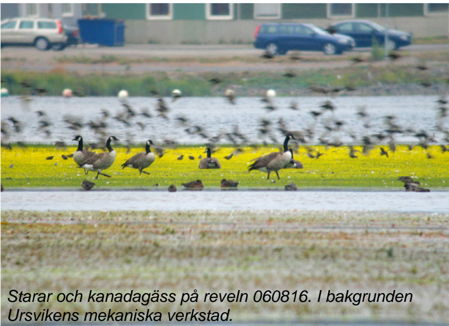
Starar och kanadagäss på reveln 060816. I bakgrunden Ursvikens mekaniska verkstad.

använder området som fiskvatten, liksom inte sällan enstaka havsörnar. Bland rovfåglar ses även brun kärnhök regelbundet jagandes, och häckar sannolikt i vassarna runt Innerviksfjärdarna. I oktober är det mest kanadagäss och sångsvanar kvar i området.