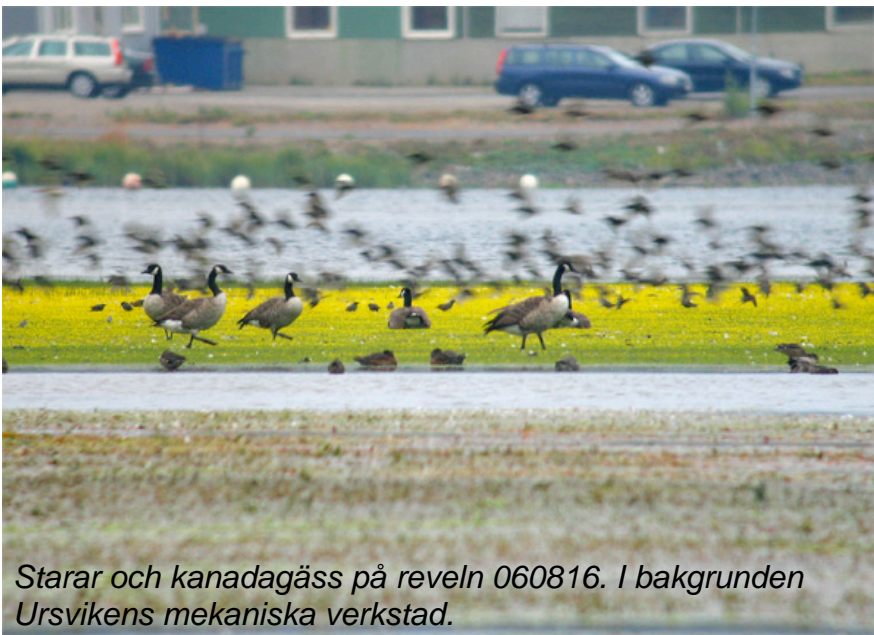
Starar och kanadagäss på reveln 060816. I bakgrunden Ursvikens mekaniska verkstad.

använder området som fiskvatten, liksom inte sällan enstaka havsörnar. Bland rovfåglar ses även brun kärrhök regelbundet jagandes, och häckar sannolikt i vassarna runt Innerviksfjärdarna. I oktober är det mest kanadagäss och sångsvanar kvar i området.