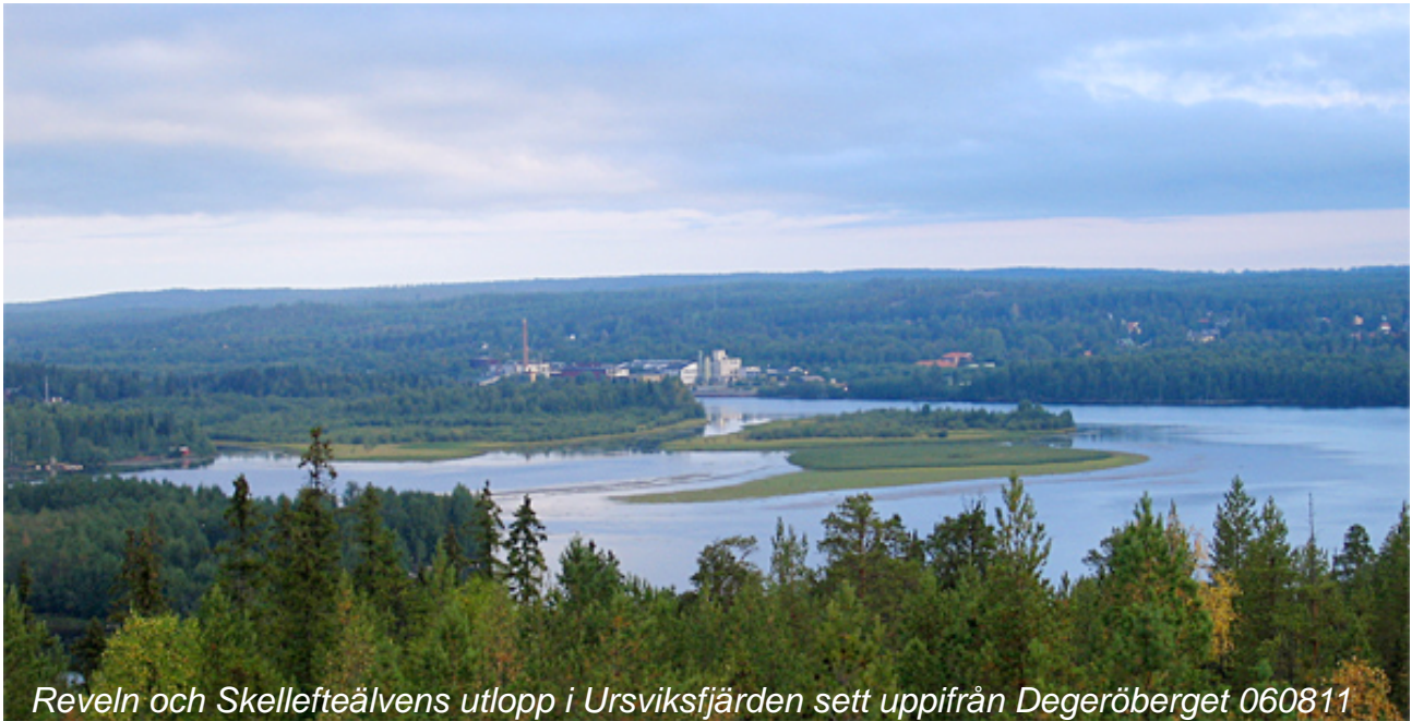
Reveln och Skellefteälvens utlopp i Ursviksfjärden sett uppifrån Degeröberget 060811

är lite av en karaktärsart för området. Sävsångare sjunger från slutet av maj i de talrika vassarna.